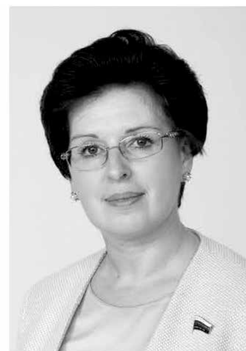
ИРИНА МАНУЙЛОВА, депутат Государственной Думы РФ, кандидат по региональному списку от Новосибирской и Омской областей.